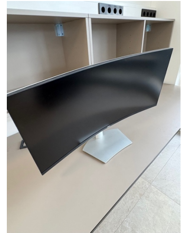
Pos 2, folgend