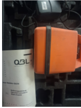
Fernschätzung - 2.jpeg