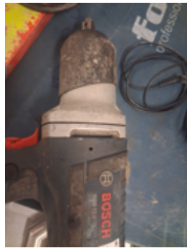
Fernschätzung - 6.jpeg