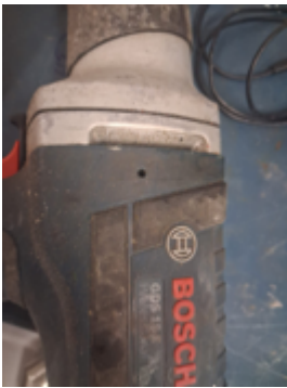
Fernschätzung - 5.jpeg