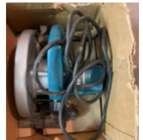
Fernschätzung - 12.jpeg