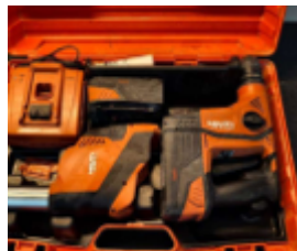
Fernschätzung - 10.jpeg