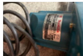
Fernschätzung - 11.jpeg