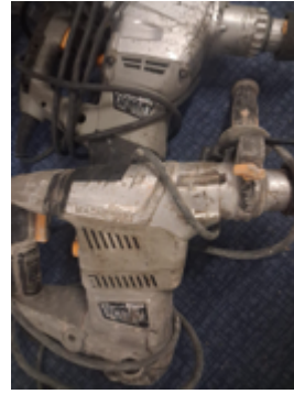
Fernschätzung - 3.jpeg