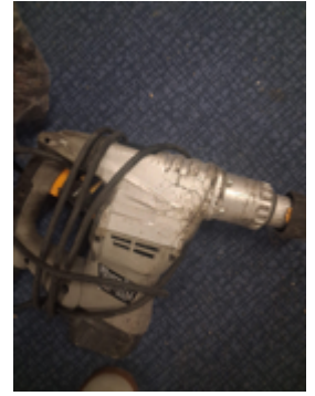
Fernschätzung - 4.jpeg