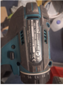
Fernschätzung - 1.jpeg