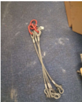
Fernschätzung - 9.jpeg