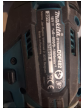
Fernschätzung - 7.jpeg