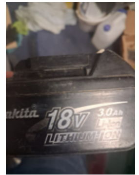
Fernschätzung - 8.jpeg